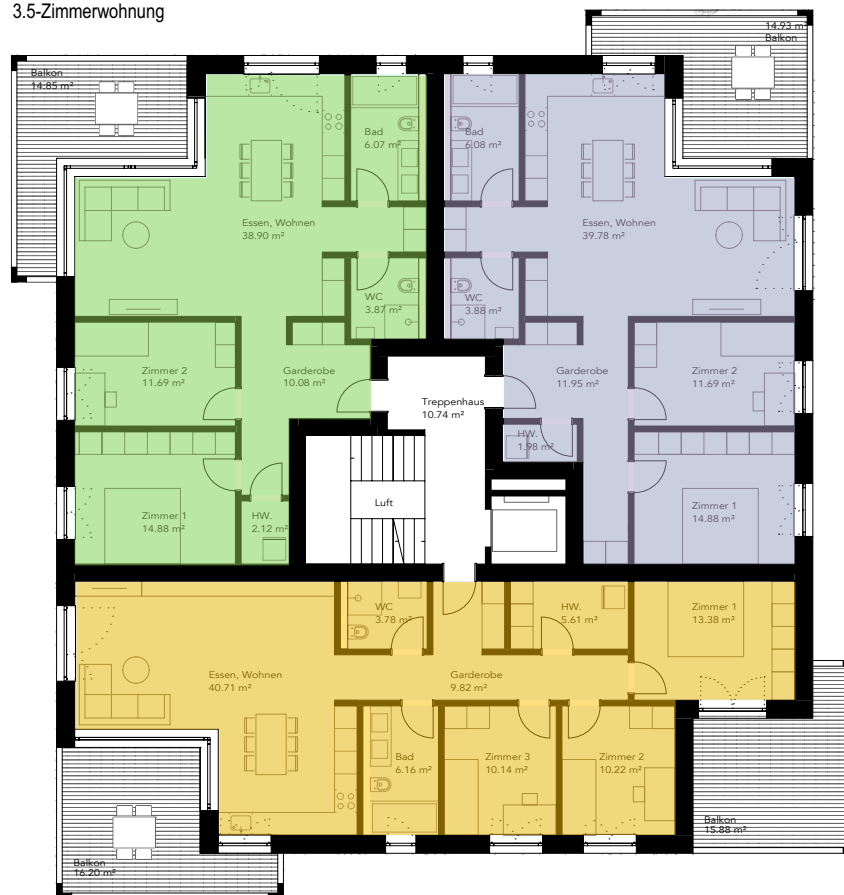
S-2-W06 87.5 m 2 3.5-Zimmerwohnung