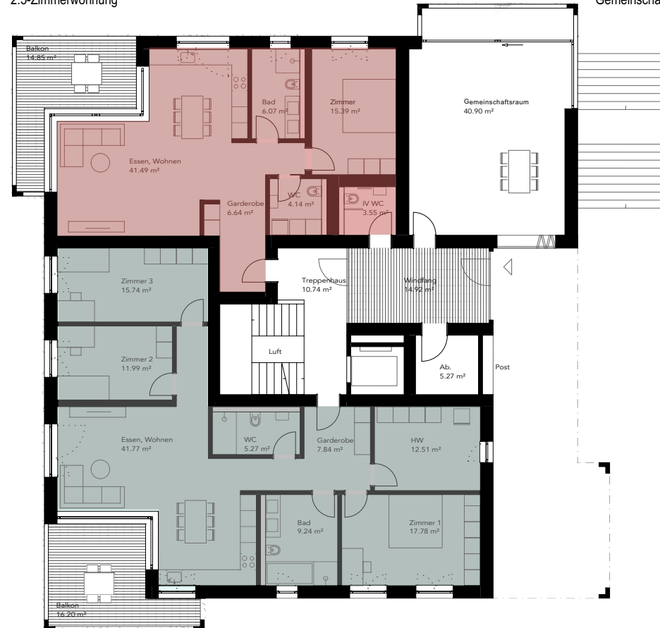
S-0-W02 122.5 m 2 5.0-Zimmerwohnung